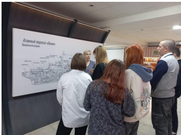
Экскурсия «Творцы атомного века», посвященная 120-летию со дня рождения А.П. Александрова