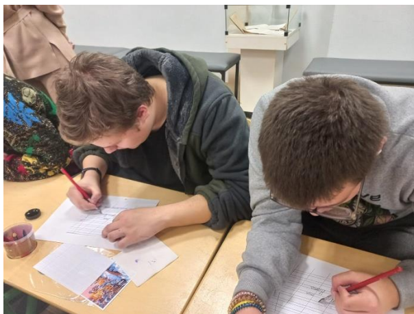
Мастер-класс «Письмо перьевыми ручками»