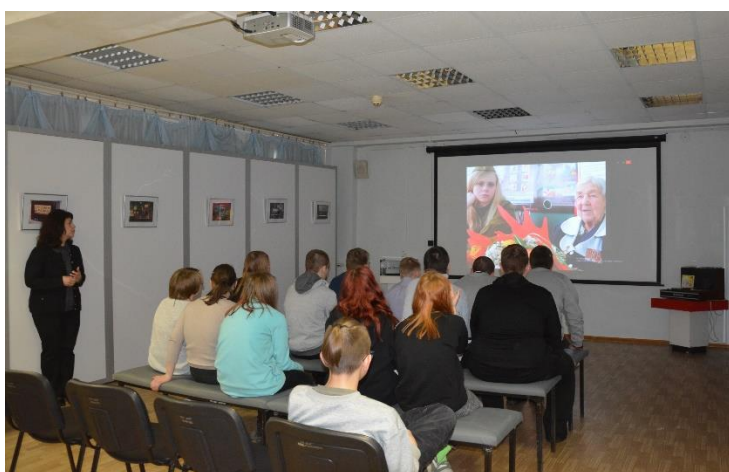
Беседа «У войны не женское лицо»