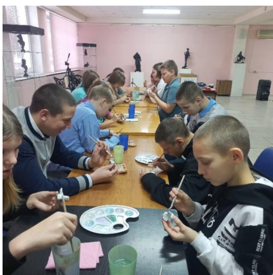
Мастер-класс по росписи глиняной игрушки - символа города Трёхгорного - глухаря.